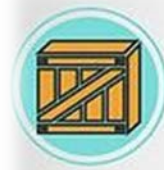
CADENA DE BASTECIMIENTO